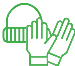
Berretto e guanti