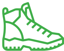
Scarponcini da trekking